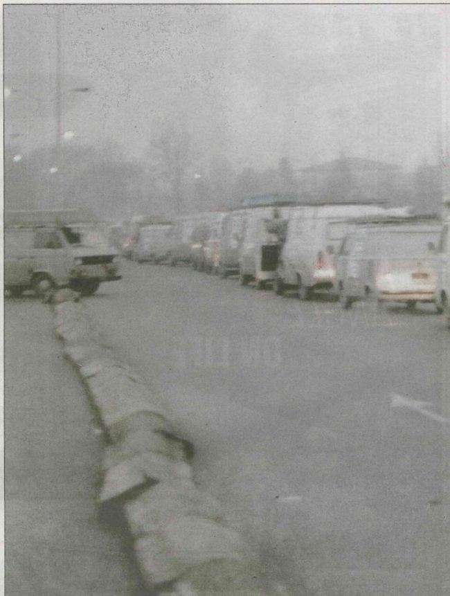
Via Giotto occupata La mattina del 25 gennaio 1992 gli ambulanti protestarono per chiedere il trasferimento del mercato da piazza Sant'Agostino che non poteva più accogliere tutti i banchi