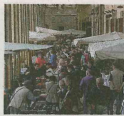
La mostra-mercato tra antico e moderno