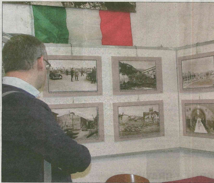
FotoAntiquaria, conto alla rovescia Domenica torna la mostra-mercato con il consueto set fotografico naturale: una modella in Piazza Grande ed anche l'esposizione di auto d'epoca