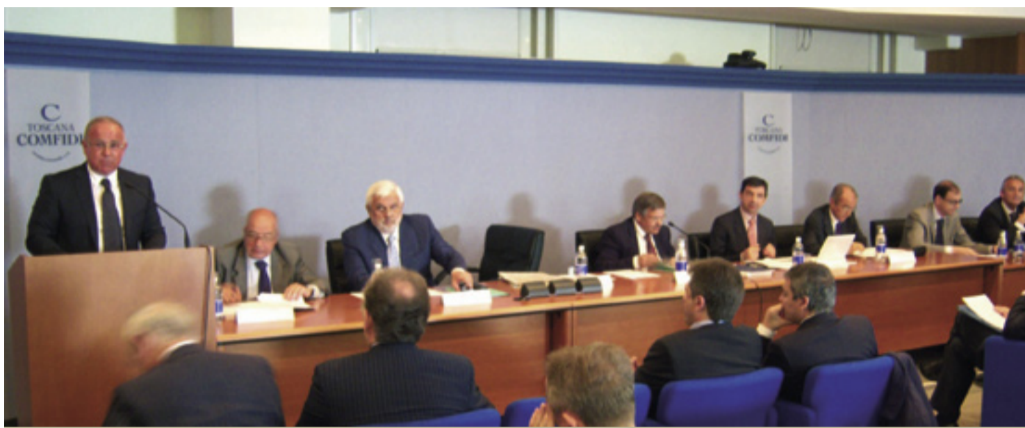
Tavola rotonda a margine dell'Assemblea annuale