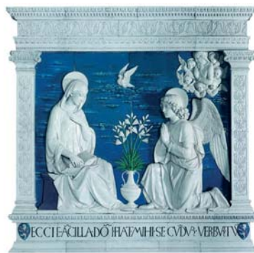
Carnevale, Sansovino dialogheranno con quelle dei Della Robbia e con gli altri maestri delle arti decorative. I 16 Comuni coinvolti saranno legati